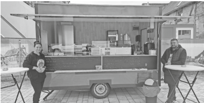
Stefanie und Orkan Sahin vor ihrem Imbiss auf dem Mengener Wochenmarkt

Das Ehepaar Orkan und Stefanie Sahin bereichert den Wochenmarkt am Samstag mit ihrem KultImbiss. Sie bieten dabei ein reichhaltiges Speisen- und Getränkesortiment. Es werden Speisen aus Rindfleisch wie Köfte ( Türkische Frikadellen ) mit Pommes oder im Brot, Currywurst ( Rote/Weiße ) mit Pommes, Rote im Brötchen, Chicken Nuggets mit Pommes angeboten. An Getränken findet sich neben einer Auswahl an Softdrinks auch Kaffee und Cappuccino im Angebot.