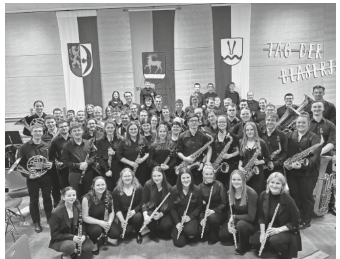
Das KVJO Sigmaringen nach ihrem gelungenen Konzert beim "Tag der Bläserjugend 2024".

Die Verantwortlichen der Bläserjugend Sigmaringen sowie die Ausrichter bedanken sich herzlich bei den teilnehmenden Kindern und Jugendlichen die sich über den Tag an den Wertungsspielen beteiligt haben und gratulieren allen zu ihren ausgezeichneten Ergebnissen. Ebenso beim Kreisverbandsjugendorchester Sigmaringen das eindrucksvoll zeigte was Blasmusik stilistisch zu bieten hat und auf welchem Niveau die musikalische Ausbildung im Landkreis Sigmaringen ist. Ein großer Dank auch an das zahlreich angereiste Publikum das nicht nur durch den langanhaltenden Applaus seine Wertschätzung zum Ausdruck brachte sondern auch durch die hohe Spendenbereitschaft. Diese kommt der vereinseigenen Jugendarbeit des MV Blochingen zugute.